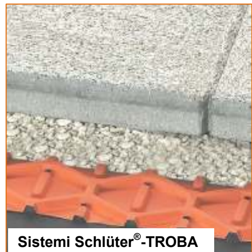
Sistemi Schlüter® -TROBA