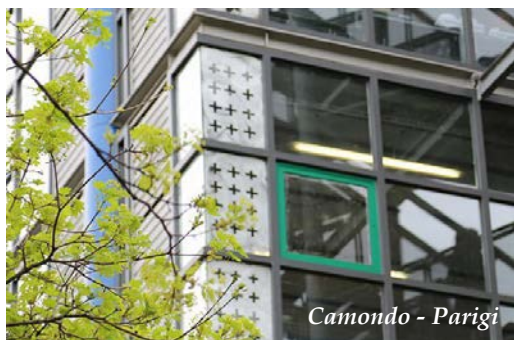
Camondo - Parigi

Mercoledì 7 settembre 2016 dalle 9:00 alle 18:30 - Parigi