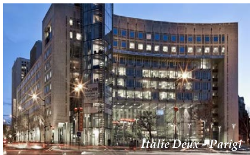
Italie Deux - Parigi

Sviluppo di centri commerciali, società presente in 16 paesi, estensione del centro del Val d'Europe